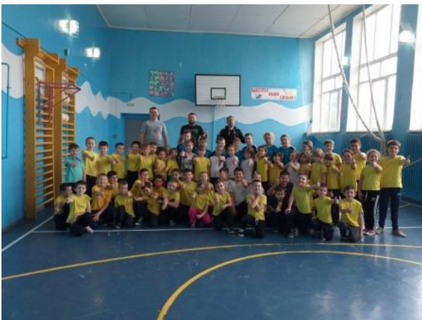
Спортивные соревнования «Папа и я со спортом друзья»