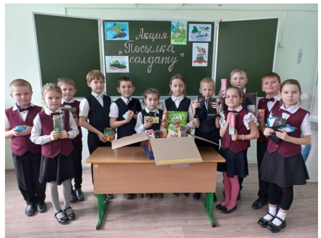
Акция «Посылка солдату»