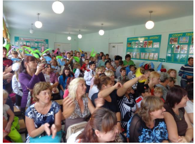
День рождения «Дома»