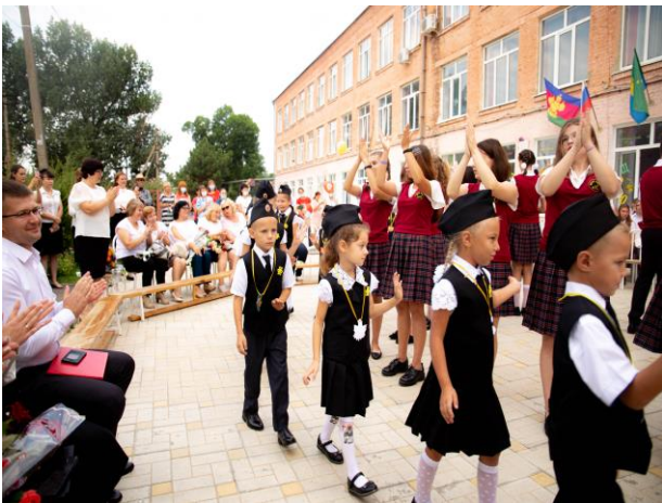
Дом принимает новых жителей