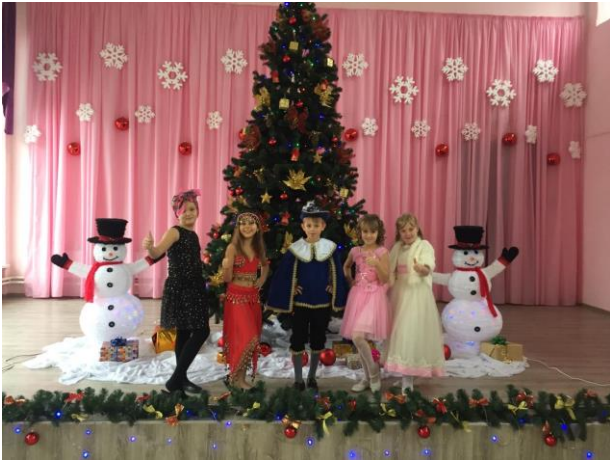
Домашний маленький театр