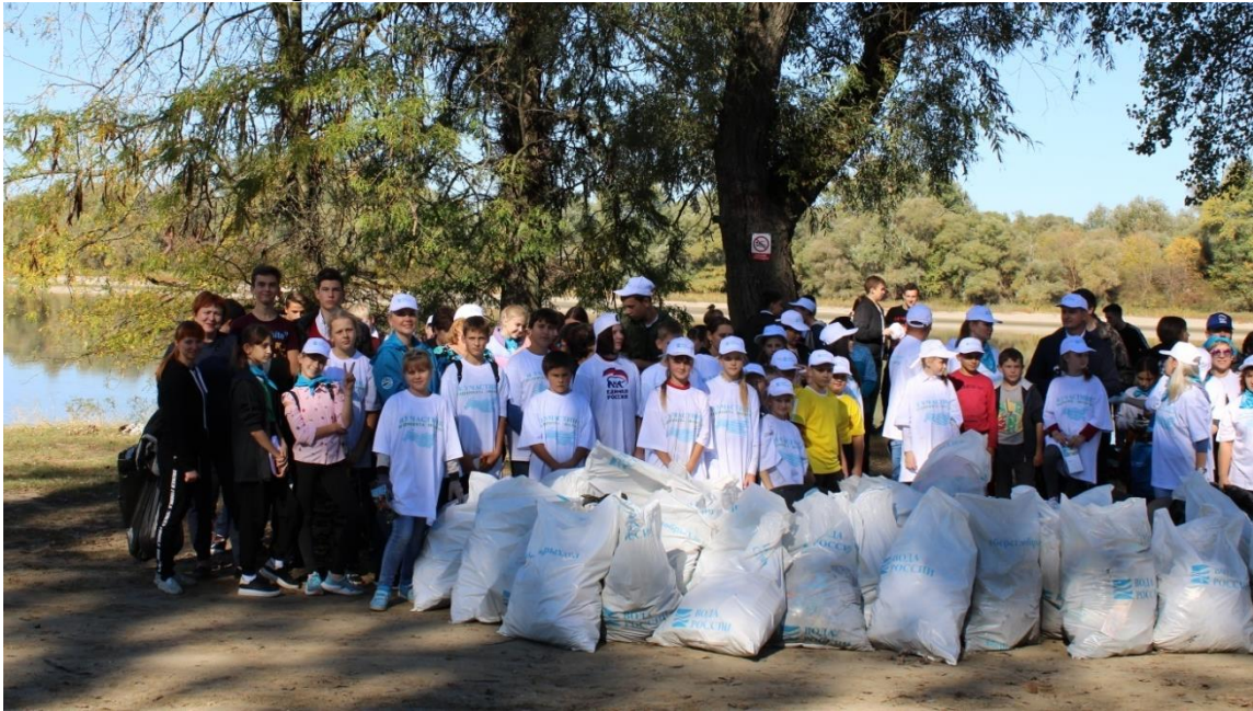
Акция «Чистые берега»