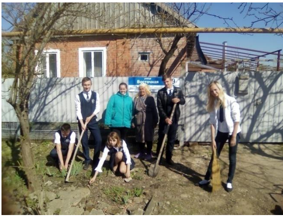
Акция «Всегда рядом»