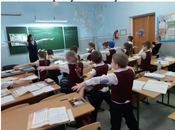
Акция «Крутая зарядка»