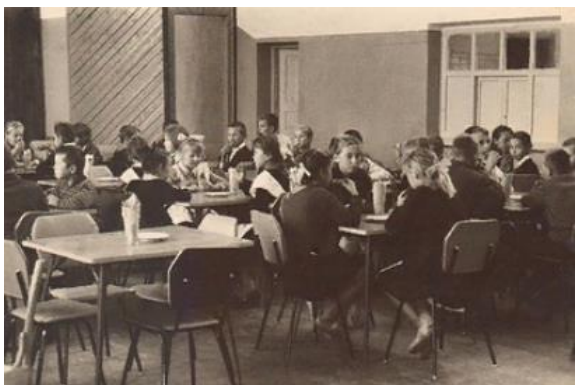
Школьная столовая 1969 год