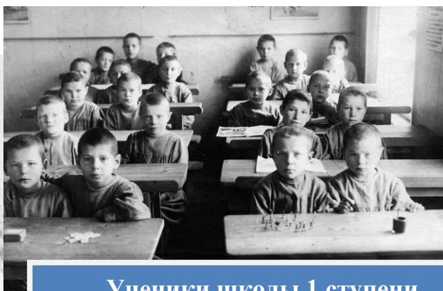
Ученики школы 1 степени