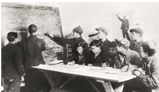
Ученики школы колхозной молодёжи 1928 год