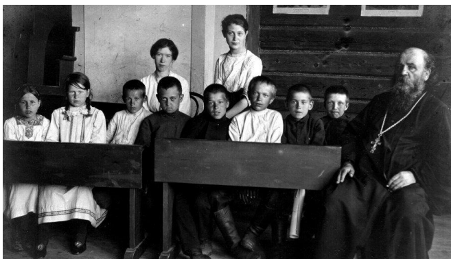
Церковно-приходская школа ст.Фёдоровской